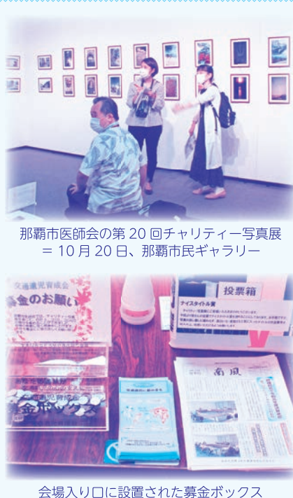
那覇市医師会の第20回チャリティー写真展 ＝10月20日、那覇市民ギャラリー

■訂正■ 第93号4頁「交通遺児で10人に奨学金 儀間教育振興会が県外進学者などに」の記事で、数字等に間違いがありました。正しくは「当育成会推薦で同振興会の奨学金が給付された学生は、1993年から28年間で322人、給付総額7454万円」でした。お詫びして訂正いたします。