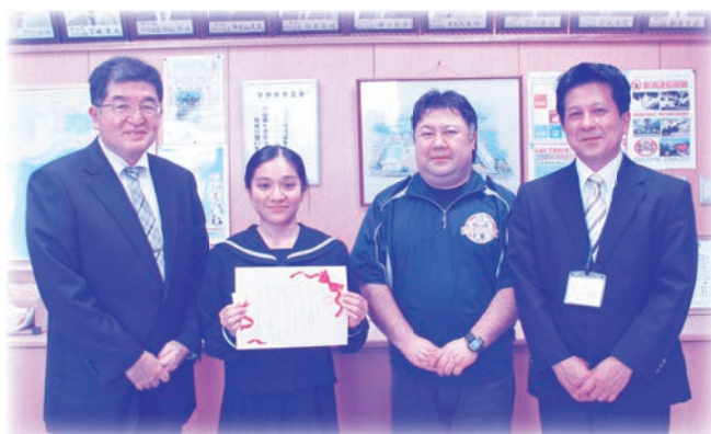
✿ 中城中学校 ✿

■訂正■ 第93号4頁「交通遺児で10人に奨学金 儀間教育振興会が県外進学者などに」の記事で、数字等に間違いがありました。正しくは「当育成会推薦で同振興会の奨学金が給付された学生は、1993年から28年間で322人、給付総額7454万円」でした。お詫びして訂正いたします。